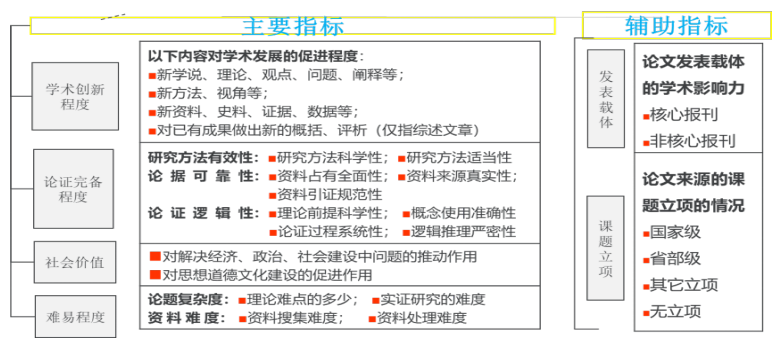
图2 人文社科学术论文质量评估指标体系

近10年来,中国人民大学人文社科学术成果评价研究中心以人大“复印报刊资料”转载数据为依据,连续发布年度转载指数及期刊、机构等的影响力排行榜,社会影响力、认可度逐年加大,充分证明了人大“复印报刊资料”向基于评价的转载、向知识服务和学术评价方向发展是正确的。原国家新闻出版广电总局副局长、中国期刊协会会长吴尚之在2019年3月26日中国人民大学人文社科成果评价发布论坛暨学术评价与学科发展研讨会讲话中指出,“人大评价”体系有三个鲜明特色,即注重“创新和质量”为导向、注重“定量与定性相结合的复合评价”方法和注意加强“同行评议”的主体地位。