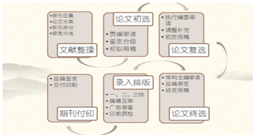
图1 编辑出版流程图

心一直按照现代管理制度要求，从来源报刊征集入库、期刊基本信息著录、论文学科分类标引，到编辑团队初选、复选、专家评选、领导终审，直到录入、排版、印制、发行，每一环节都制定了规章制度和操作要求，构筑了完整的编辑出版管理制度体系（图1）。