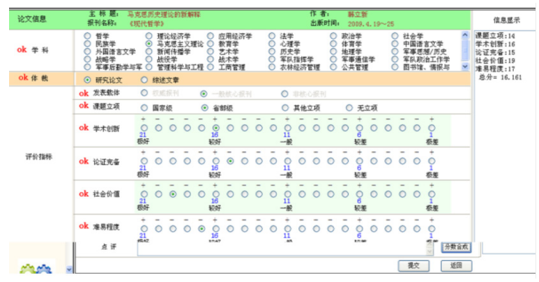
图3 人大书报资料中心入选论文网上评分页面