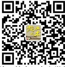
《施工技术》官方微信