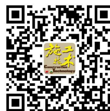
《施工技术》增刊缴费